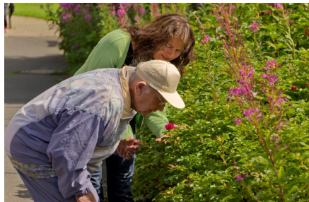
Fotowettbewerb Lichte Momente - Alzheimer Gesellschaft SH

Treffpunkt: Gemeindehaus an der Kirche St. Gabriel, Marktplatz 4, Haseldorf